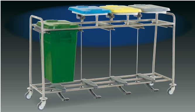
WSP410LT met voetbediening