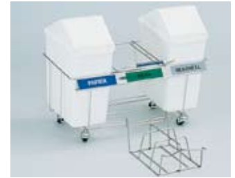
HLW 31F met rek voor flessen