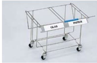
Onderstel voor HLW 20F en HLW 21F